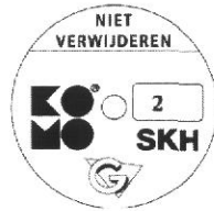
geschikt voor weerstandsklasse 2